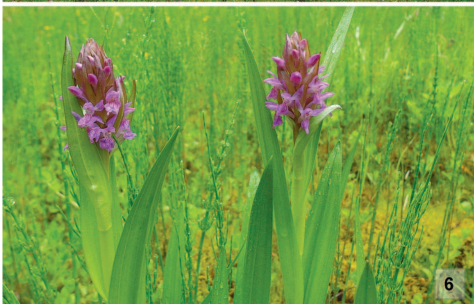
Obr. 5–6. 5. Mokřadní louka v PP Křtinský lom, lokalita č. 33. – A wetland meadow in the Křtinský lom Nature Monument, locality no. 33. (Photo: V. Taraška.); 6. Dactylorhiza incarnata v PP Křtinský lom, lokalita č. 33. – Dactylorhiza incarnata in the Křtinský lom Nature Monument, locality no. 33. (Photo: V. Taraška.)