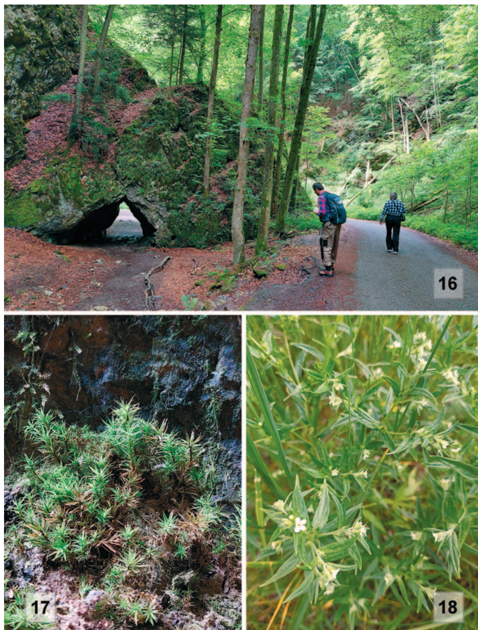
Obr. 16–18. 16. Místo nálezu Cololejeunea calcarea , Čertova branka v Pustém žlebu, lokalita č. 9. – A site of Cololejeunea calcarea , the Čertova branka in the Pustý žleb valley, locality no. 9. (Photo: J. Tkáčiková.); 17. Timmia bavarica na dně propasti Macocha, lokalita č. 12. – Timmia bavarica on the bottom of the Macocha abyss, locality no. 12. (Photo: J. Tkáčiková.); 18. Lithospermum officinale při cestě z Vilémovic k Macoše, lokalita č. 14. – Lithospermum officinale near the road from Vilémovice village to Macocha abbys, locality no. 14. (Photo: J. Tkáčiková.)