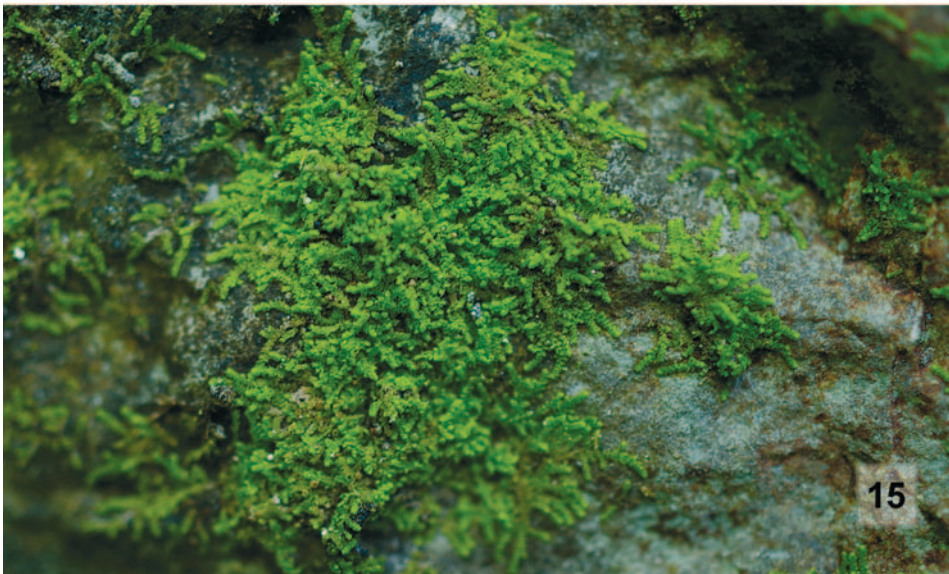
Obr. 14–15. 14. Drymocallis rupestris v údolí Rakovce, lokalita č. 41. – Drymocallis rupestris in the Rakovec valley, locality no. 41. (Photo: V. Taraška.); 15. Cololejeunea calcarea v Pustém žlebu, lokalita č. 9. – Cololejeunea calcarea in Pustý žleb valley, locality no. 9. (Photo: J. Tkáčiková).