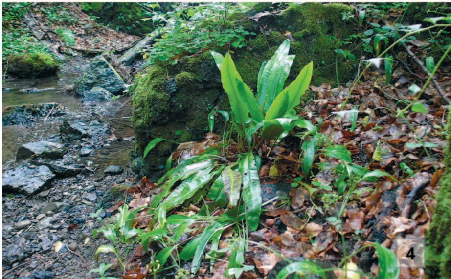
Obr. 3–4. 3. Clematis recta na Stránské skále, lokalita č. 1. – Clematis recta at Stránská skála, locality no. 1. (Photo: V. Taraška.); 4. Asplenium scolopendrium na nově objevené lokalitě v PR Rakovecké stráně a údolí bledulí, lokalita č. 43. – Asplenium scolopendrium at the newly discovered locality in the Rakovecké stráně a údolí bledulí Nature Reserve, locality no. 43. (Photo: V. Taraška.)